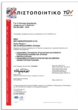
✓ EN ISO 9001:2015

Η BIRO είναι πιστοποιημένη κατά ISO 9001, ISO 14001 και ISO 45001.