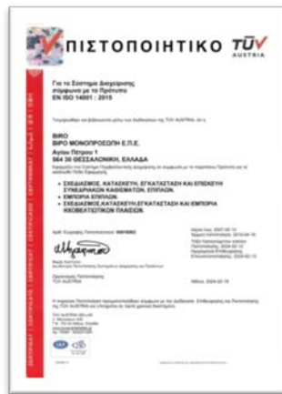
✓ EN ISO 14001:2015